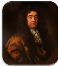
William PETTY (1623-1687)

„Umjesto da upotrebljavam samo poredbene i superlativne riječi i intelektualne argumente, pokušao sam da se izrazim u brojevima, težinama i mjerama“